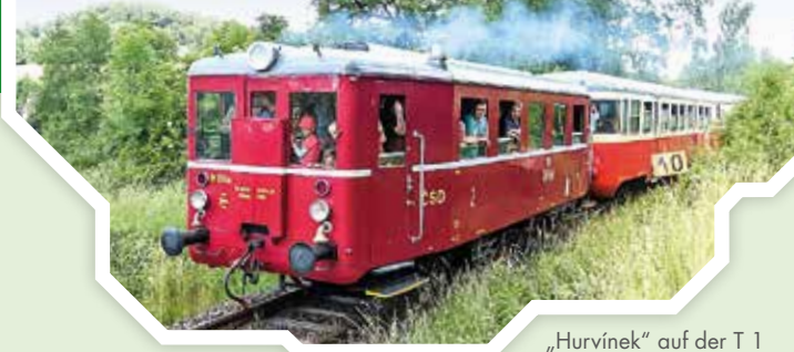
„Hurvínek“ auf der T 1

Infos zu Fahrplan und Tarif Regionalverkehr Sächsische Schweiz-Osterzgebirge (RVSOE) Telefon 03501 7111999, www.rvsoe.de