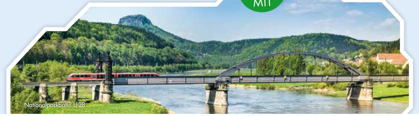
Nationalpark beim U28