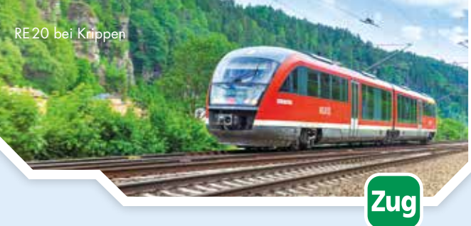
RE 20 bei Krippen

Von April bis Oktober ergänzen die Züge der touristischen Bahnlinie T2 die Reismöglichkeiten für Wanderer und erschließen so die böhmische Nationalparkregion zwischen Mikulášovice, Panský und Krásná Lipa.