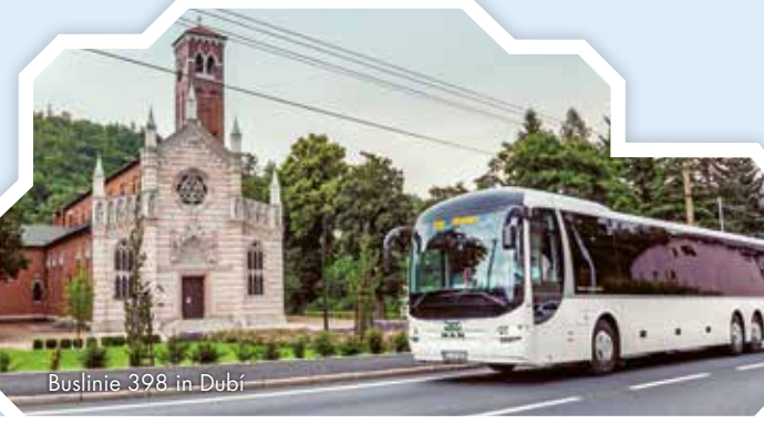
Buslinie 398 in Dubí

Für Einzelfahrten auf diesen grenzüberschreitenden Linien kann anstelle des Elbe-Labe-Tickets ein Ticket nach Sonder- bzw. DÚK-Tarif direkt in den Fahrzeugen erworben werden.