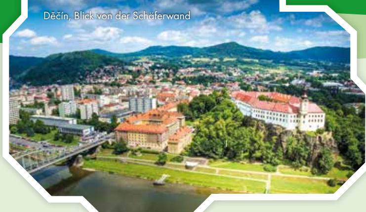
Děčín, Blick von der Schieferwand

Infos zum Fahrplan www.vvo.de/de/T-Linien-CZ (nur tschechisch)